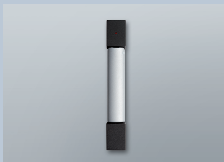
Serrure pour armoire informatique