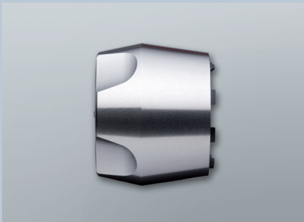
Knauf für schwergängige Türen (Z4.KNAUF7)