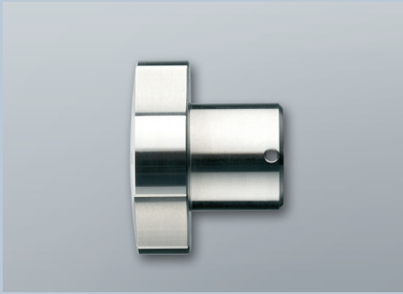
Knauf für schwergängige Türen (Z4.KNAUF2)