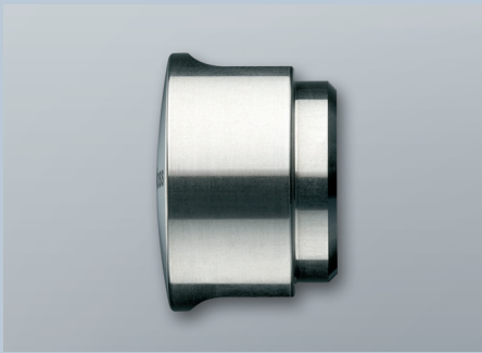
verkürzter Knauf (Z4.KNAUF4)