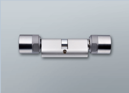
British Oval Comfortzylinder 3061

Digitaler Schließzylinder mit gekapselter Elektronikbaugruppe zum Einbau in Türen mit British Oval Profil. Er wertet Funksignale von Transpondern aus und entscheidet, ob eine Zugangsberechtigung besteht.