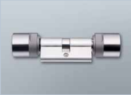
Cilindro confort de perfil europeo 3061